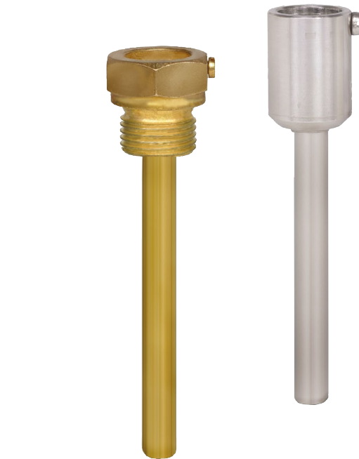
Рис. слева: гильза с резьбой

Благодаря наличию широкого ассортимента опций конструкций и материалов пользователь может подобрать оптимальный вариант гильзы для специальных условий применения. Выбор гильзы зависит от типа технологического соединения (фланцевое, резьбовое и стерильное соединение) и условий производственного процесса. Основные варианты конструкции представлены резьбовыми, приварными и фланцевыми гильзами.